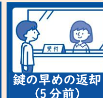
鍵の早めの返却 (5分前)