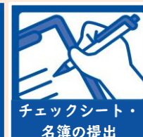
チェックシート・ 名簿の提出